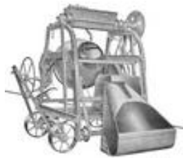
Wiel Rutten beton