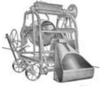
Wiel Rutten beton